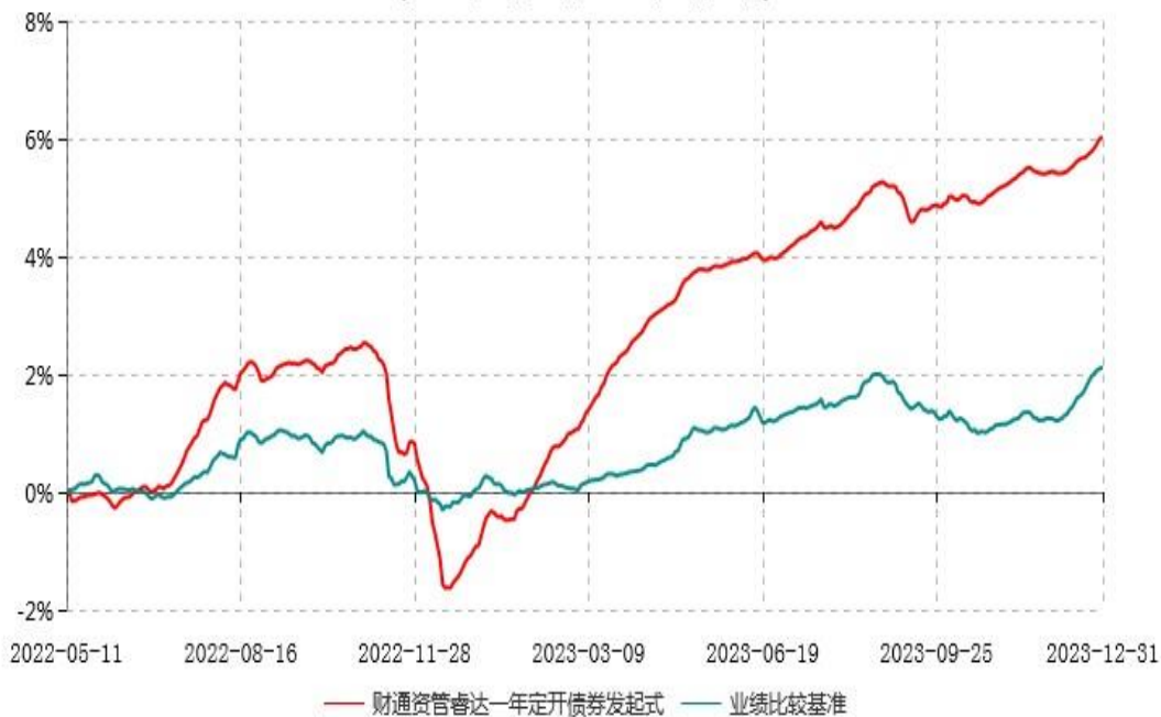
财通资管睿达一年定期开放债券型发起式证券投资基金累计净值增长率与业绩比较基准收益率历史走势对比图 (2022年05月11日-2023年12月31日)