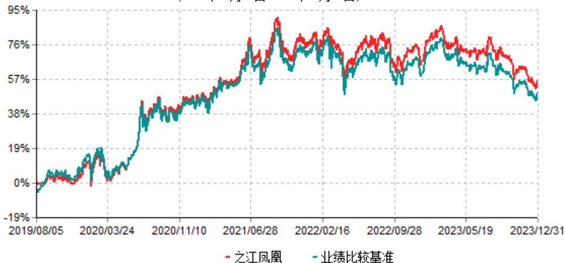
浙商汇金中证浙江凤凰行动50交易型开放式指数证券投资基金累计净值增长率与业绩比较基准收益率历史走势对比图 (2019年08月05日-2023年12月31日)