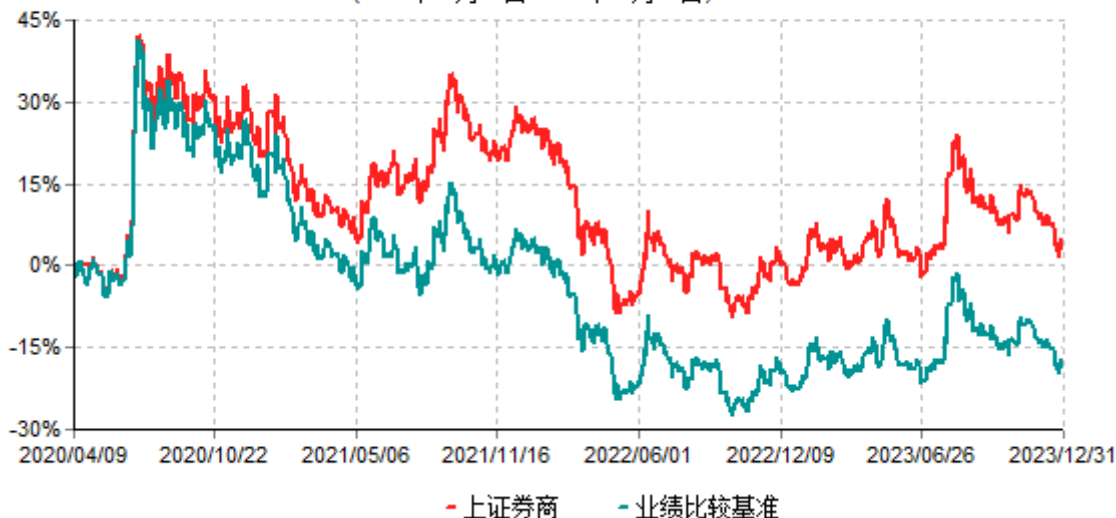
汇安上证证券交易型开放式指数证券投资基金累计净值增长率与业绩比较基准收益率历史走势对比图 (2020年04月09日-2023年12月31日)