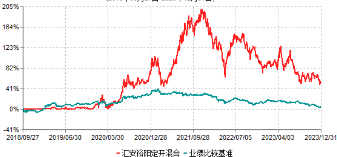
汇安裕阳三年定期开放混合型证券投资基金累计净值增长率与业绩比较基准收益率历史走势对比图 (2018年09月27日-2023年12月31日)