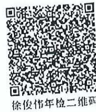
徐俊伟年检二维码

本证书经检验合格，继续有效一年。 This certificate is valid for another year after this renewal.