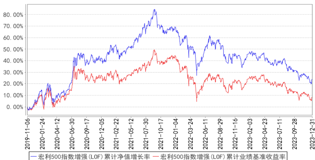
宏利500指数增强(LOF)累计净值增长率与同期业绩比较基准收益率的历史走势对比图