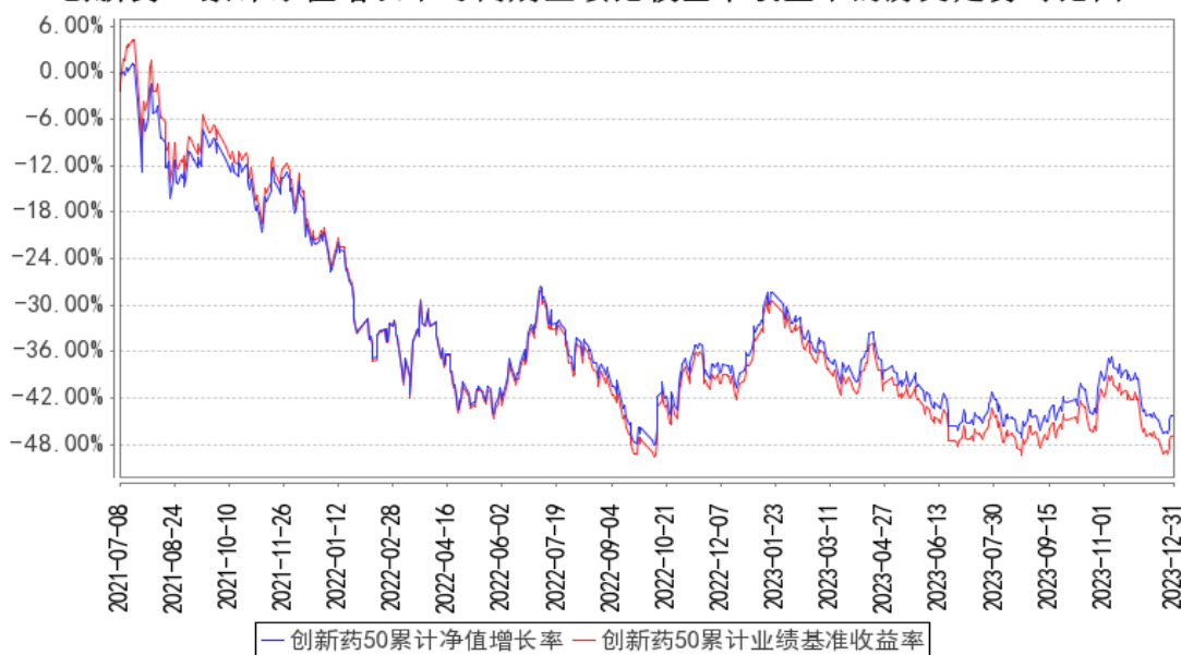
创新药50累计净值增长率与同期业绩比较基准收益率的历史走势对比图

注：图示日期为 2021 年 7 月 8 日至 2023 年 12 月 31 日。