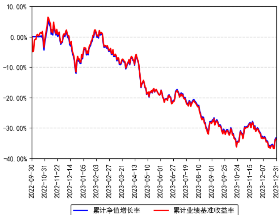
南方上证科创板新材料ETF累计净值增长率与同期业绩比较基准收益率的历史走势对比图