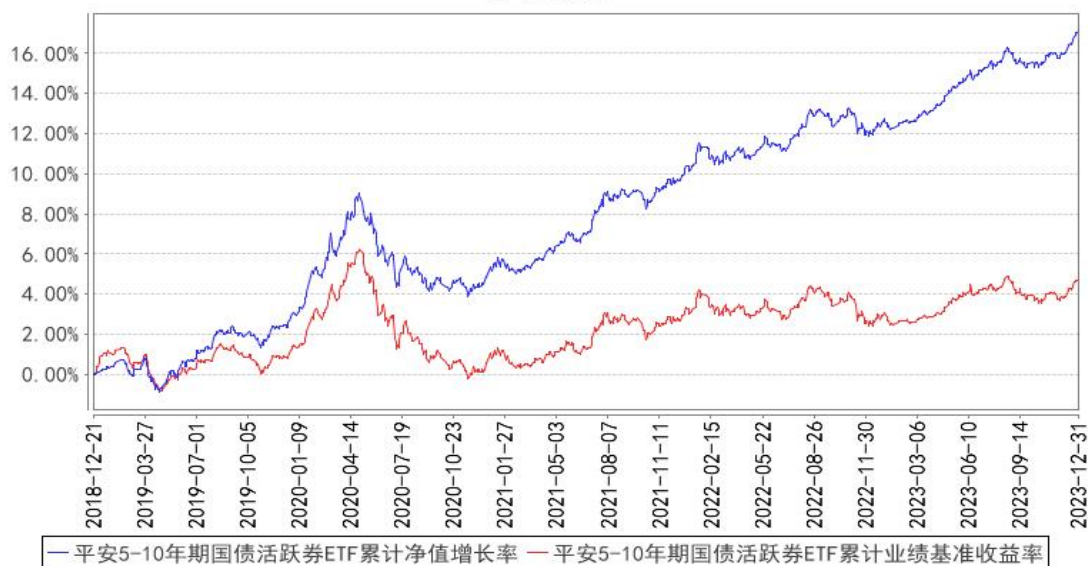
平安5-10年期国债活跃券ETF累计净值增长率与同期业绩比较基准收益率的历史走势对比图