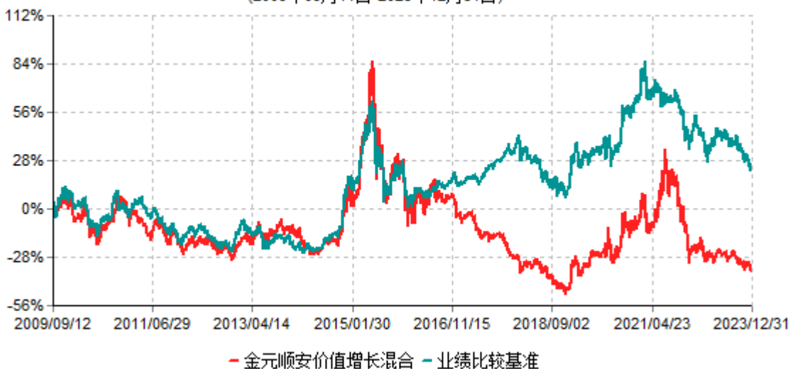
金元顺安价值增长混合型证券投资基金累计净值增长率与业绩比较基准收益率历史走势对比图 (2009年09月11日-2023年12月31日)