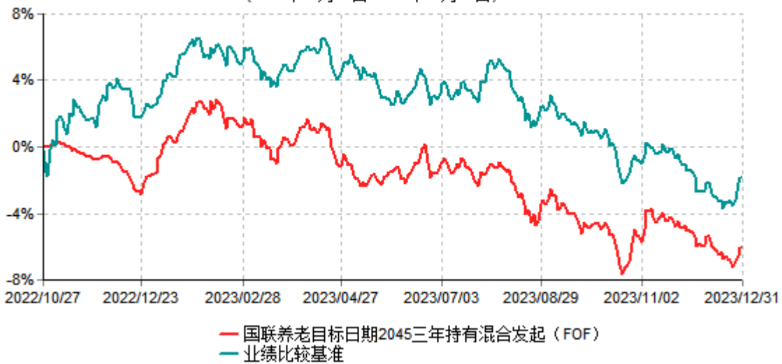
国联养老目标日期2045三年持有期混合型发起式基金中基金（FOF）累计净值增长率与业绩比较基准收益率历史走势对比图 (2022年10月27日-2023年12月31日)

注：按基金合同和招募说明书的约定，本基金自基金合同生效日起6个月内为建仓期，建仓期结束时本基金的各项投资比例符合基金合同的有关约定。