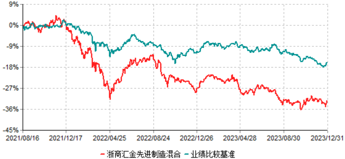
浙商汇金先进制造混合型证券投资基金累计净值增长率与业绩比较基准收益率历史走势对比图 (2021年08月16日-2023年12月31日)