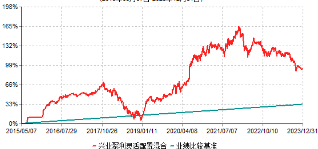
兴业聚利灵活配置混合型证券投资基金累计净值增长率与业绩比较基准收益率历史走势对比图 (2015年05月07日-2023年12月31日)

注：本基金基金合同于2015年5月7日生效，根据本基金基金合同规定，本基金自基金合同生效之日起六个月内已使基金的投资组合比例符合基金合同的约定。