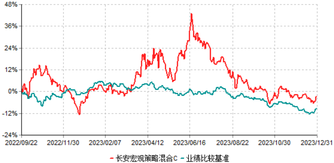
长安宏观策略混合C累计净值增长率与业绩比较基准收益率历史走势对比图 (2022年09月22日-2023年12月31日)

长安宏观策略混合C于2022年09月19日公告新增，实际首笔C类份额申购申请于2022年09月22日确认,图示日期为2022年09月22日至2023年12月31日。