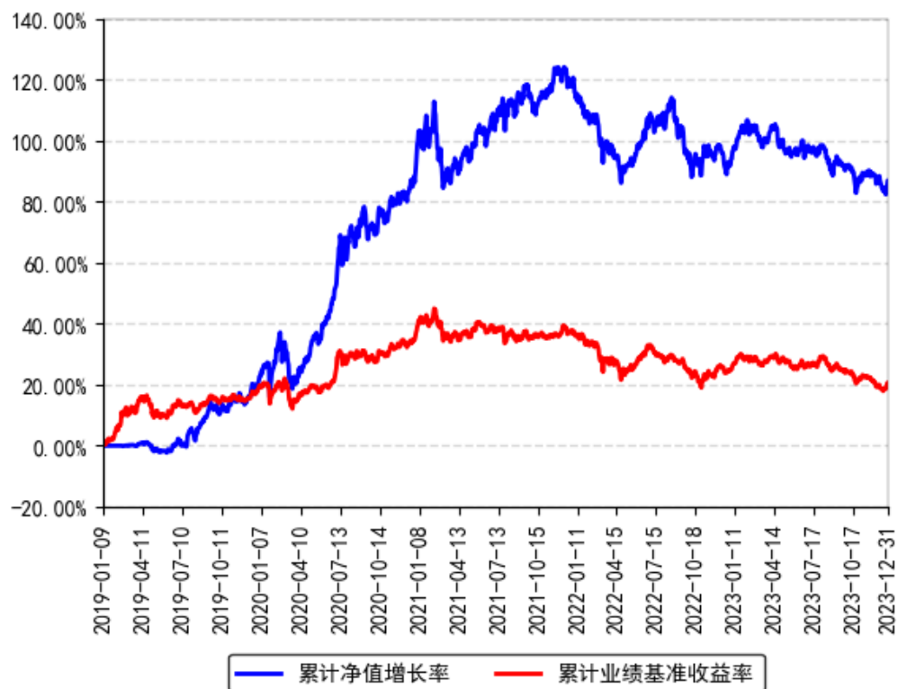
南方核心竞争混合累计净值增长率与同期业绩比较基准收益率的历史走势对比图