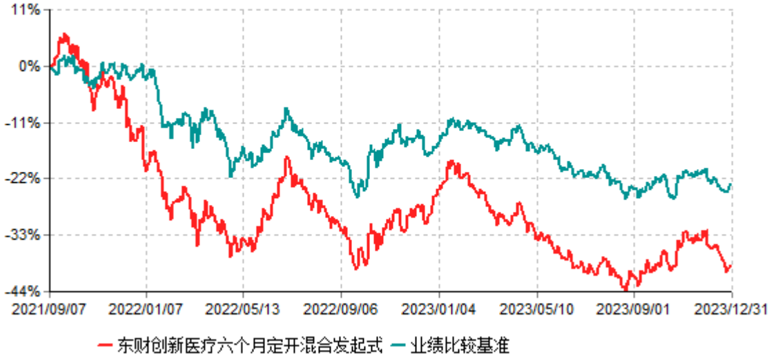
西藏东财创新医疗六个月定期开放混合型发起式证券投资基金累计净值增长率与业绩比较基准收益率历史走势对比图 (2021年09月07日-2023年12月31日)