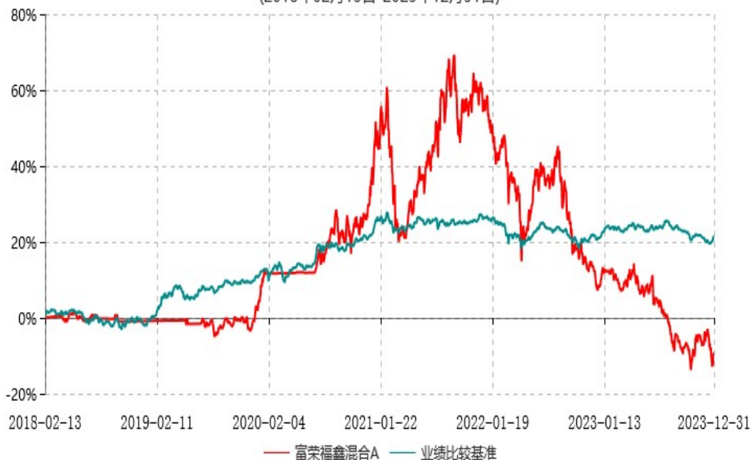
富荣福鑫混合C累计净值增长率与业绩比较基准收益率历史走势对比图