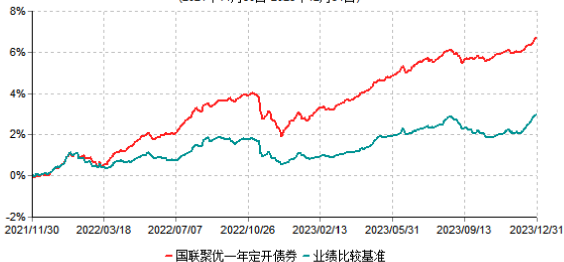
国联聚优一年定期开放债券型发起式证券投资基金累计净值增长率与业绩比较基准收益率历史走势对比图 (2021年11月30日-2023年12月31日)

注：按基金合同和招募说明书的约定，本基金自基金合同生效日起6个月内为建仓期，建仓期结束时本基金的各项投资比例符合基金合同的有关约定。