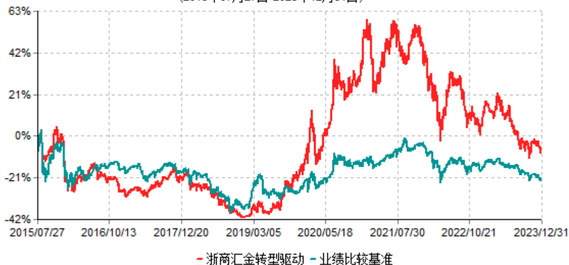
浙商汇金转型驱动灵活配置混合型证券投资基金累计净值增长率与业绩比较基准收益率历史走势对比图 (2015年07月27日-2023年12月31日)