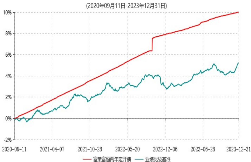
富荣富恒两年定期开放债券型证券投资基金累计净值增长率与业绩比较基准收益率历史走势对比图