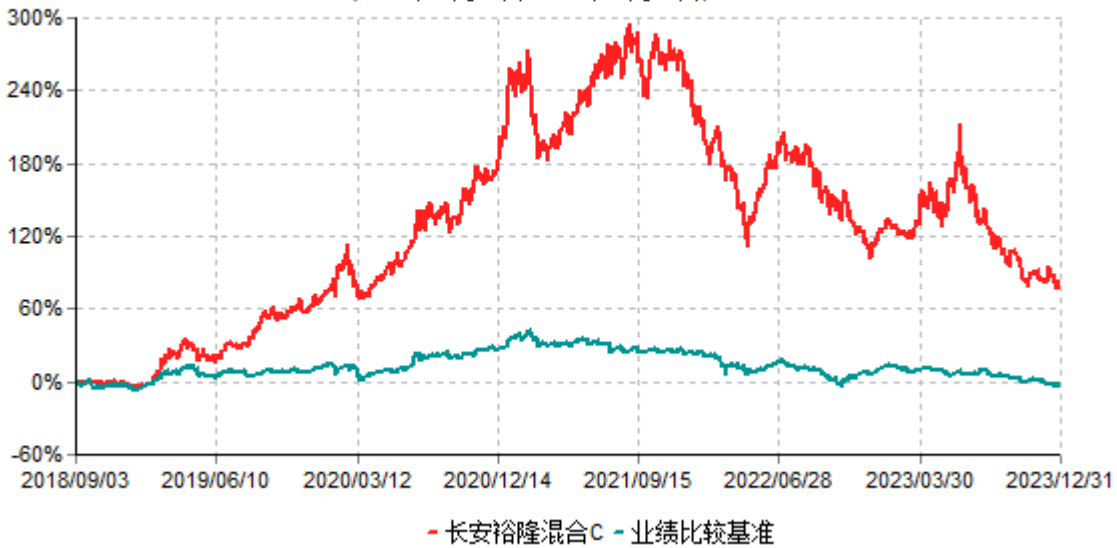
长安裕隆混合C累计净值增长率与业绩比较基准收益率历史走势对比图 (2018年09月03日-2023年12月31日)

根据基金合同的规定,自基金合同生效之日起6个月内基金各项资产配置比例需符合基金合同要求。本基金在建仓期结束后,各项资产配置比例已符合基金合同有关投资比例的约定。基金合同生效日至报告期末,本基金运作时间已满一年。图示日期为2018年09月03日至2023年12月31日。