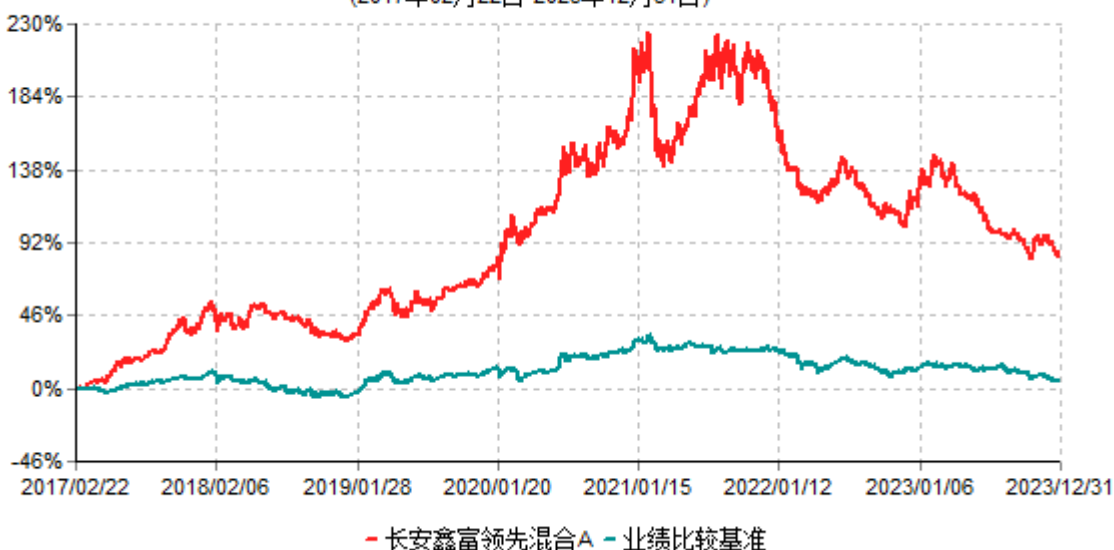
长安鑫富领先混合A累计净值增长率与业绩比较基准收益率历史走势对比图 (2017年02月22日-2023年12月31日)

根据基金合同的规定,自基金合同生效之日起6个月内基金各项资产配置比例需符合基金合同要求。本基金在建仓期结束后,各项资产配置比例已符合基金合同有关投资比例的约定。基金合同生效日至报告期期末,本基金运作时间超过一年。图示日期为2017年2月22日至2023年12月31日。