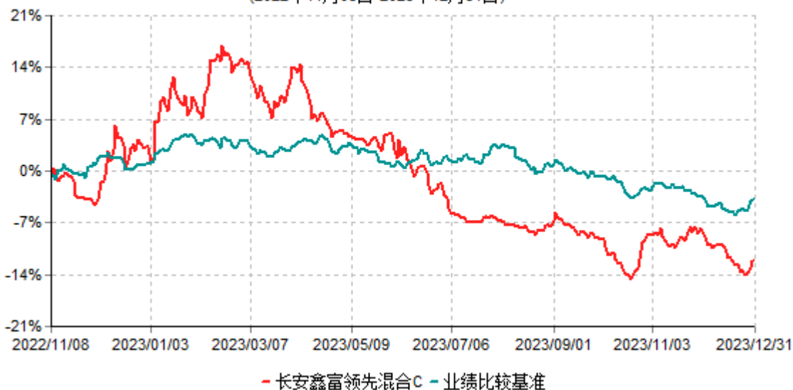
长安鑫富领先混合C累计净值增长率与业绩比较基准收益率历史走势对比图 (2022年11月08日-2023年12月31日)

长安鑫富领先混合于2022年11月7日公告新增C类份额，实际首笔C类份额申购申请于2022年11月8日确认，图示日期为2022年11月8日至2023年12月31日。