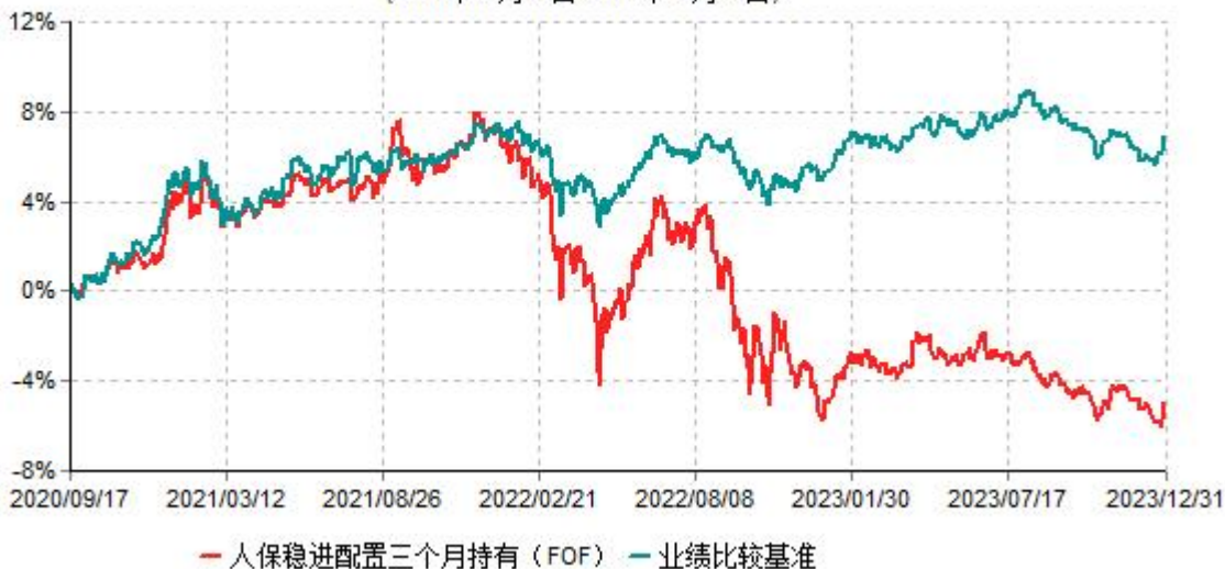
人保稳进配置三个月持有期混合型基金中基金(FOF)累计净值增长率与业绩比较基准收益率 历史走势对比图 (2020年09月17日-2023年12月31日)

注：1、本基金基金合同于2020年09月17日生效。根据基金合同规定，本基金建仓期为6个月，建仓期结束，本基金的各项投资比例符合基金合同的有关约定。