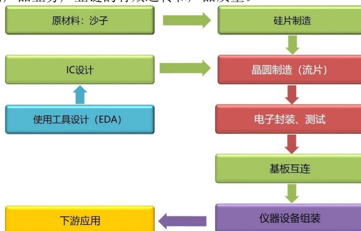
半导体产业链示意图

企业、封装和测试企业来完成。公司与国内主要的晶圆加工、封装测试厂商长期保持了良好的合作关系，保证了公司产品业务产业链的有效运转和产品质量。