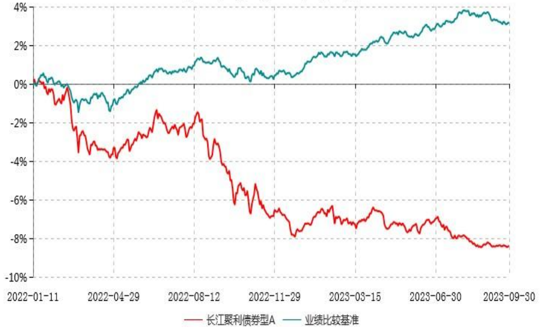
长江聚利债券型A累计净值增长率与业绩比较基准收益率历史走势对比图 (2022年01月11日-2023年09月30日)

注：本基金A类份额“自基金合同生效以来”的报告期为2022年1月11日至2023年9月30日。