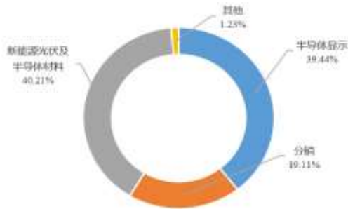
图 1：2022 年收入构成情况

公司前身 TCL 集团有限公司，成立于 1981 年，后经股改并于 2004 年在深圳证券交易所挂牌上市(000100.SZ)。2019 年 4 月，公司进行重大资产重组，剥离终端及配套业务；2020 年 2 月公司更为现名；2020 年第四季度公司股权收购天津中环电子信息集团有限公司 1 ；2021 年 5 月公司向关联方 TCL 实业控股股份有限公司出售 TCL 金服控股（广州）集团有限公司 100% 股权，至此，公司形成以半导体显示、新能源光伏及半导体材料业务为核心主业的业务架构。2022 年公司实现营业收入总收入 1,666.32 亿元。