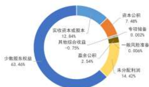
图 6：截至 2023 年 9 月末公司所有者权益构成