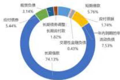
图 5：截至 2023 年 9 月末公司总债务构成