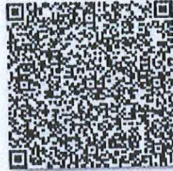
前年的年检二维码

本证书经检验合格，继续有效一年。 This certificate is valid for another year after this renewal.