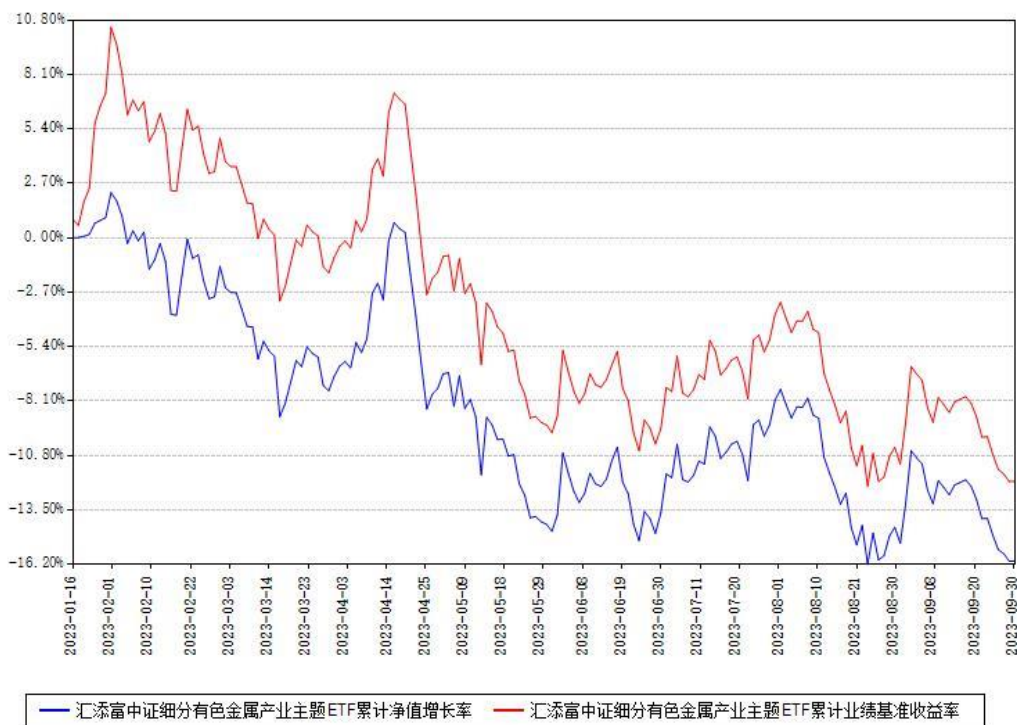
汇添富中证细分有色金属产业主题ETF累计净值增长率与同期业绩基准收益率对比图