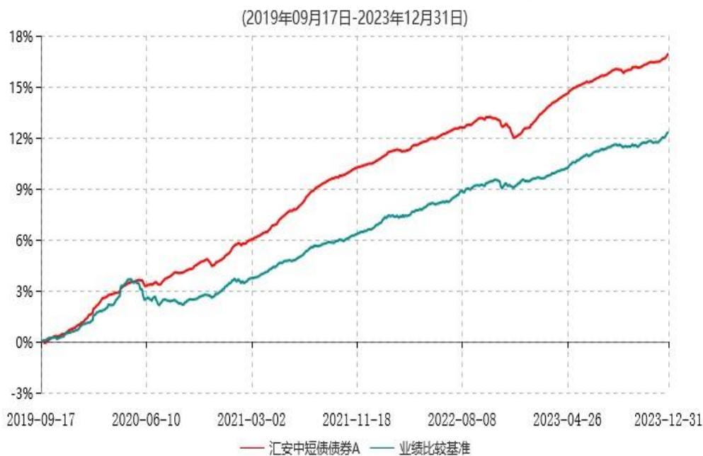
汇安中短债债券A累计净值增长率与业绩比较基准收益率历史走势对比图

2、自基金合同生效以来基金累计净值增长率变动及其与同期业绩比较基准收益率变动的比较