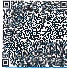
须更新的年检二维码

本证书经检验合格，继续有效一年。 This certificate is valid for another year after this renewal.