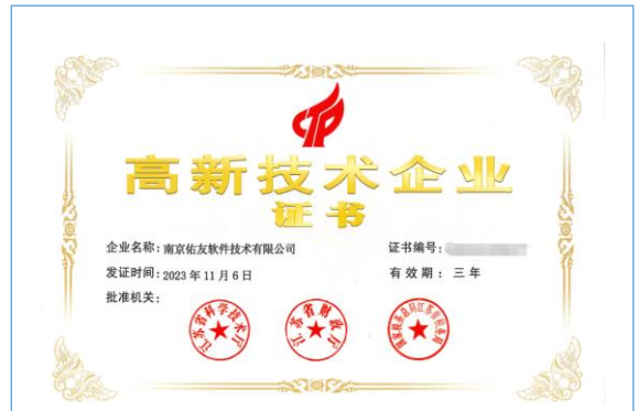
全资子公司南京佑友软件技术有限公司复审通过高新技术企业认定