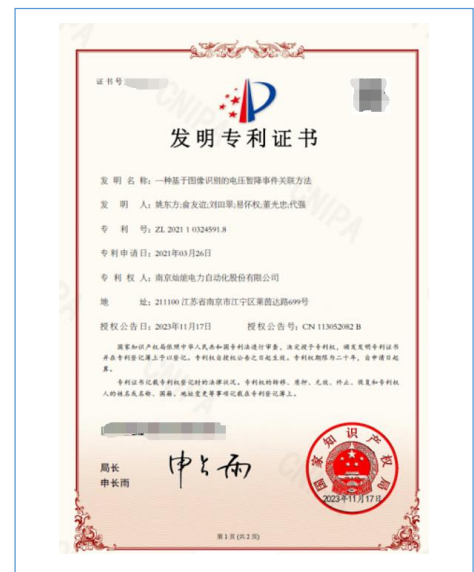
2023年11月获得发明专利“一种基于图像识别的电压暂降事件关联方法”