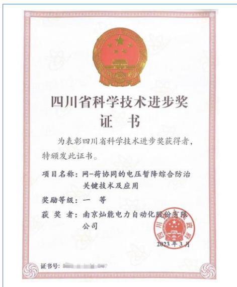
2023年3月荣获四川省科学技术进步奖一等奖