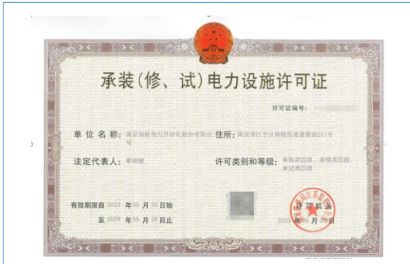
2023年5月获得承装（修、试）电力设施许可证