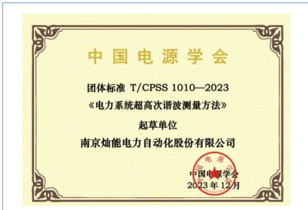
2023年12月成为《电力系统超高次谐波测量方法》团标 T/CPSS 1010-2023 起草单位