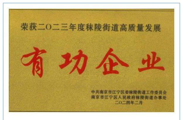
荣获 2023 年度秣陵街道高质量发展有功企业