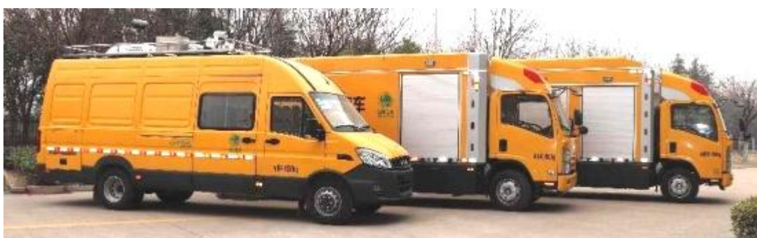
不停电旁路作业系统

主要介绍：旁路作业系统包括移动箱变车、环网柜车、旁路布缆车、开关车等组成，车辆采用专用二类载货汽车底盘上加装车厢，车内配备变电系统、环网柜、旁路作业设备、接地系统、照明系统以及其他辅助设备构成，具有耐候性强、操作简单、使用安全的特点。主要用于不停电检修配网线路及相关设备。