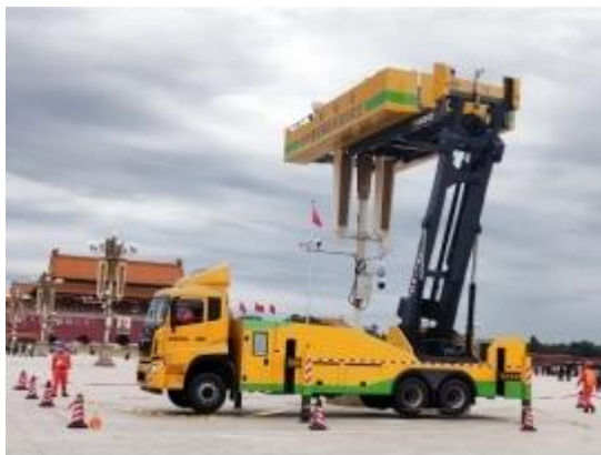
第五代华灯检修车