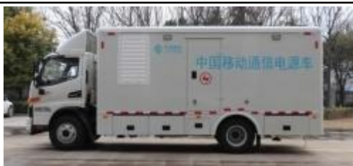
50-75kW 应急电源车（通讯行业使用较多）

主要介绍：本车型采用 5-10 吨专用汽车底盘上加装特制静音车厢，车厢内可配备 50-200kW 发电机组、控制柜、燃油箱、电缆及其卷盘等。主要适用于电力、通信、市政等应急供电保障作业工况，可快速对抢修抢建设施设备进行临时供电作业，作业时长可达 8 小时。