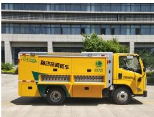
移动环网柜车（可进入地下室作业）