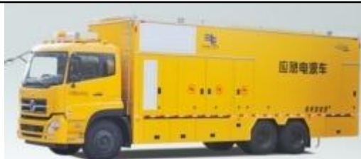
纯 UPS 不间断电源车 300KVA_U300

主要介绍： 本车型为自主研发的高静音型电源车；主要适用于电力、通信、市政等应急供电保障作业工况；本车是为了满足重要场所重大政治活动高规格保电要求，保障重要负荷的高可靠性、高安全性不间断供电的移动 UPS 电源系统。系统是由以下部分组成：发电机组（选配）、UPS 电源（含 ATS 交流屏及电池开关柜、蓄电池、冷却系统等）、车辆底盘、厢体及监控系统等。