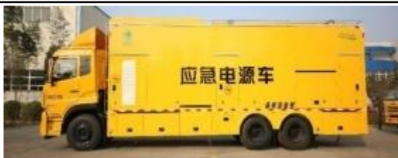
混合 UPS 不间断电源车