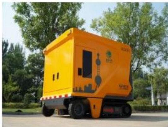
小型化履带式箱变车