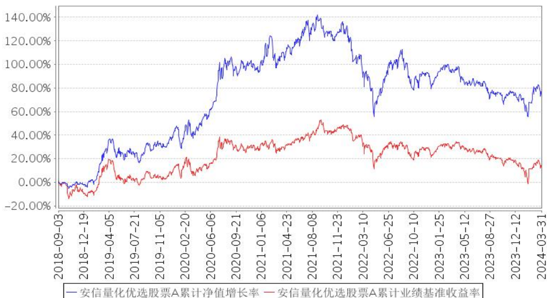
安信量化优选股票A累计净值增长率与同期业绩比较基准收益率的历史走势对比图