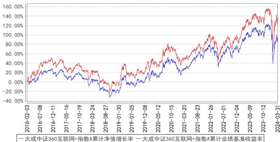
大成中证360互联网+指数A累计净值增长率与同期业绩比较基准收益率的历史走势对比图