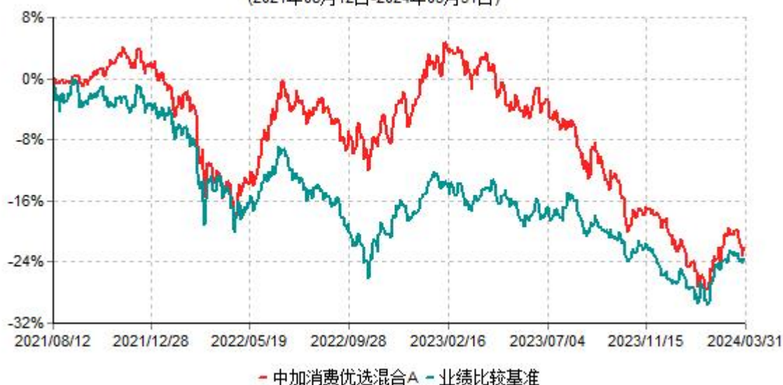
中加消费优选混合A累计净值增长率与业绩比较基准收益率历史走势对比图 (2021年08月12日-2024年03月31日)