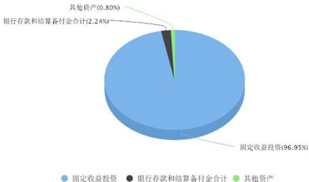
投资组合资产配置图表 数据截止日期:2023年12月31日