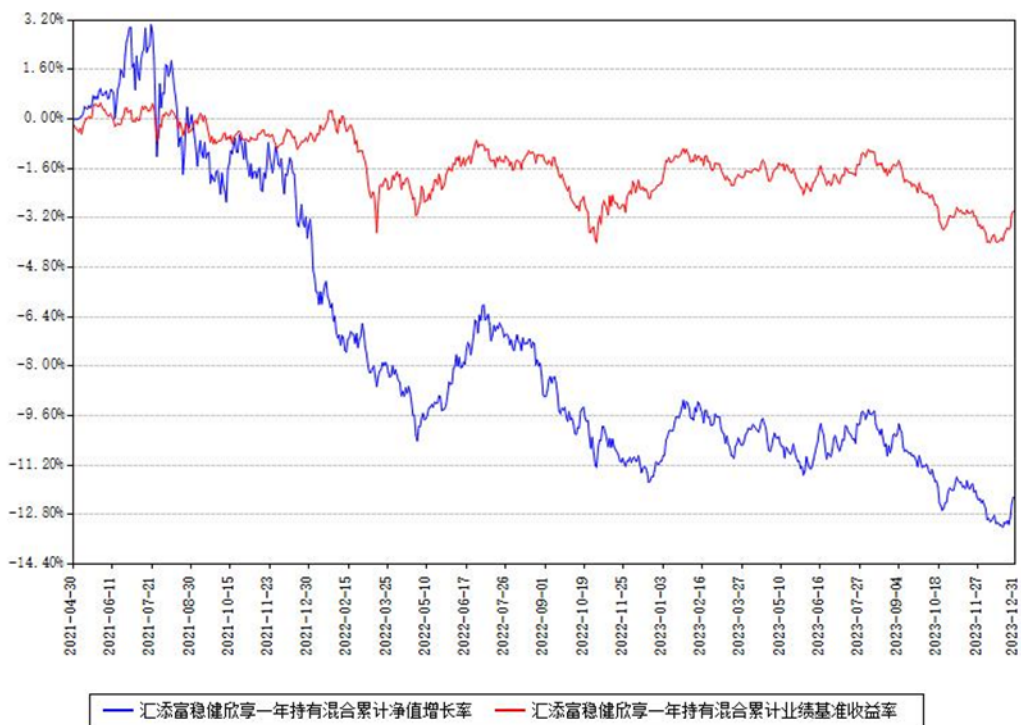
汇添富稳健欣享一年持有混合累计净值增长率与同期业绩基准收益率对比图