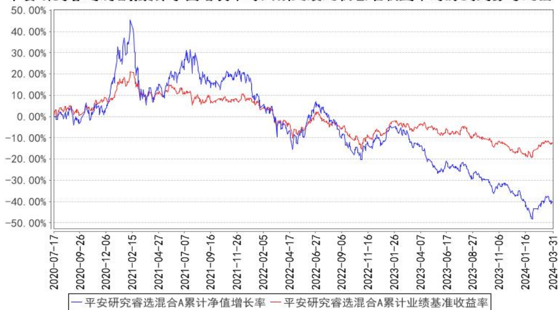
平安研究睿选混合A累计净值增长率与同期业绩比较基准收益率的历史走势对比图