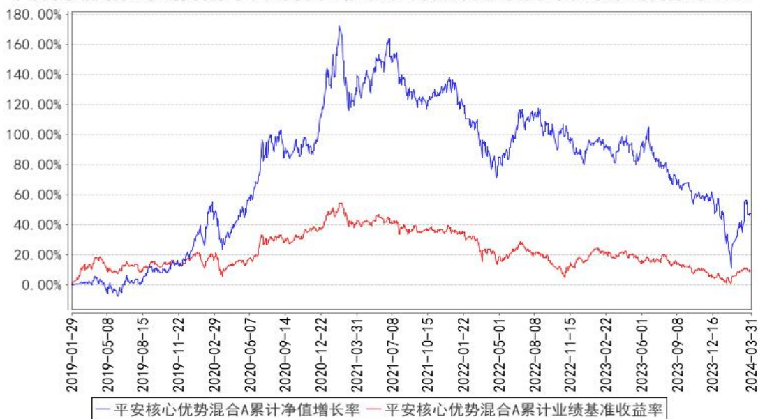
平安核心优势混合A累计净值增长率与同期业绩比较基准收益率的历史走势对比图