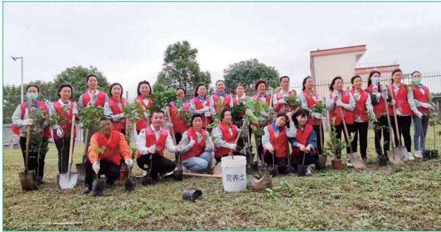
一支由23名熱心員工組成的團隊於二零二三年四月參加本集團惠州工廠的植樹義工服務，以推廣環境可持續發展，為當地生態系統作出貢獻。