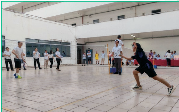
於二零二三年七月舉辦羽毛球比賽。