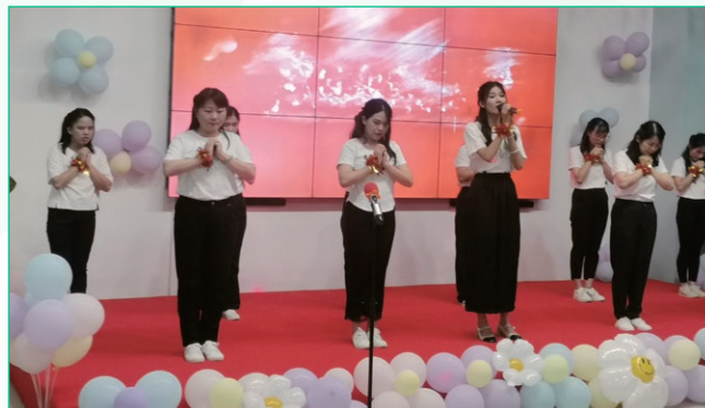
於二零二三年八月舉辦才藝競賽。