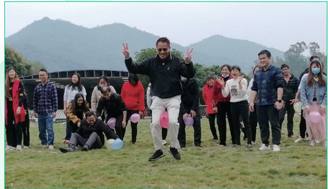
於二零二三年一月舉行團隊建設活動。