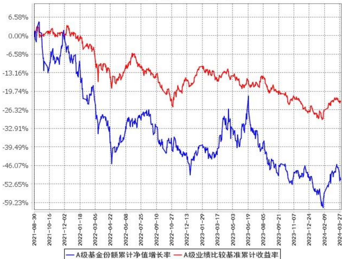
A级基金份额累计净值增长率与同期业绩比较基准收益率的历史走势对比图 (2021年8月30日至2024年3月31日)