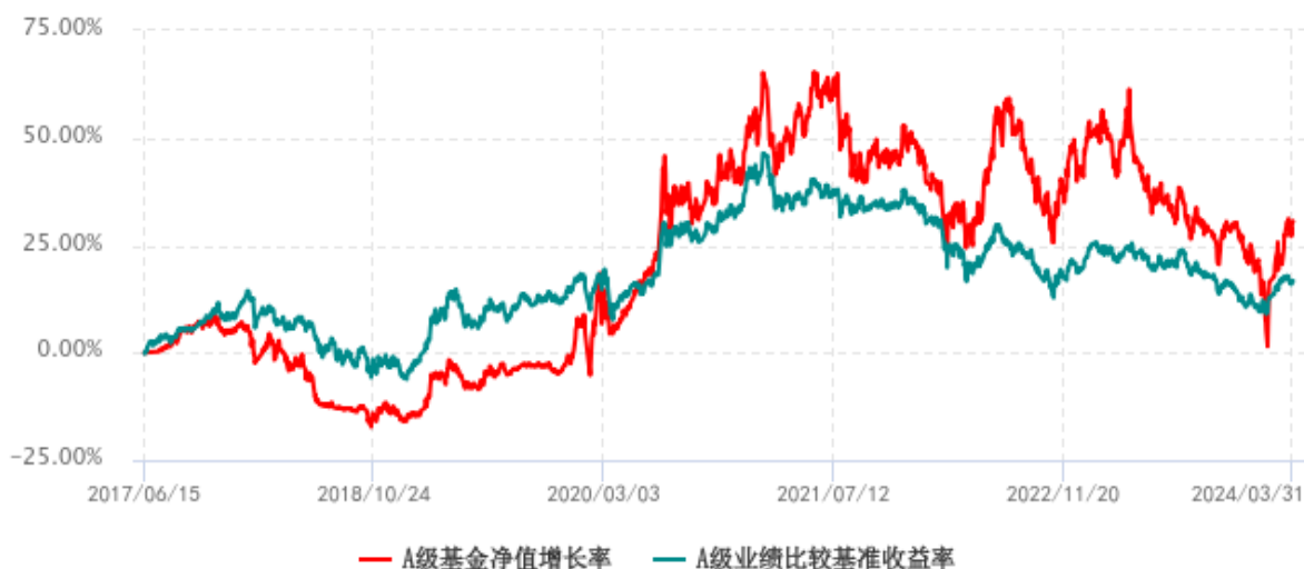
A 级基金份额累计净值增长率与同期业绩比较基准收益率历史走势对比图 (2017年06月15日-2024年03月31日)