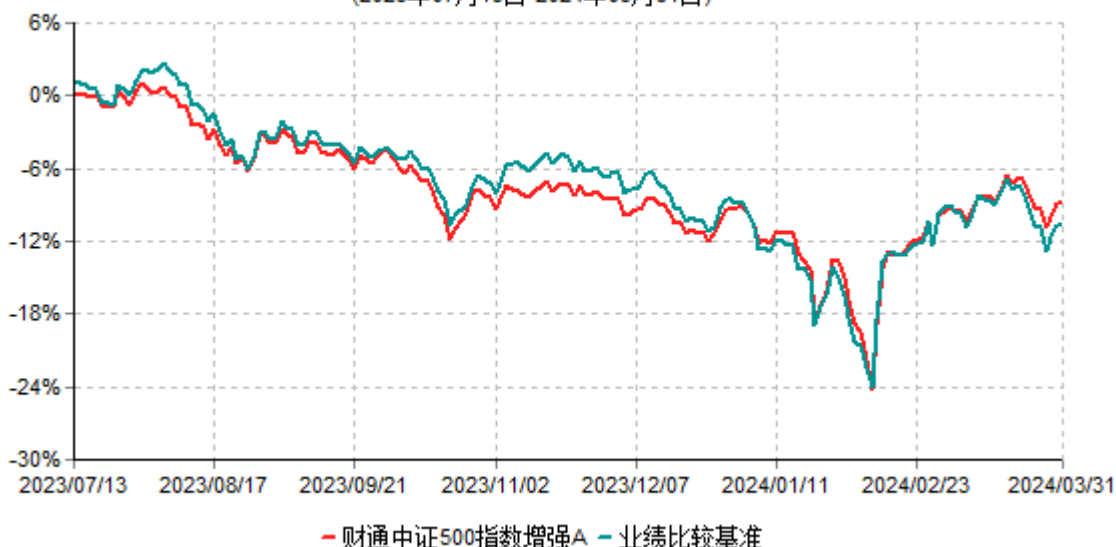
财通中证500指数增强A累计净值增长率与业绩比较基准收益率历史走势对比图 (2023年07月13日-2024年03月31日)