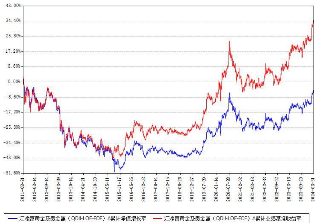
汇添富黄金及贵金属（QDII-LOF-FOF）A累计净值增长率与同期业绩基准收益率对比图