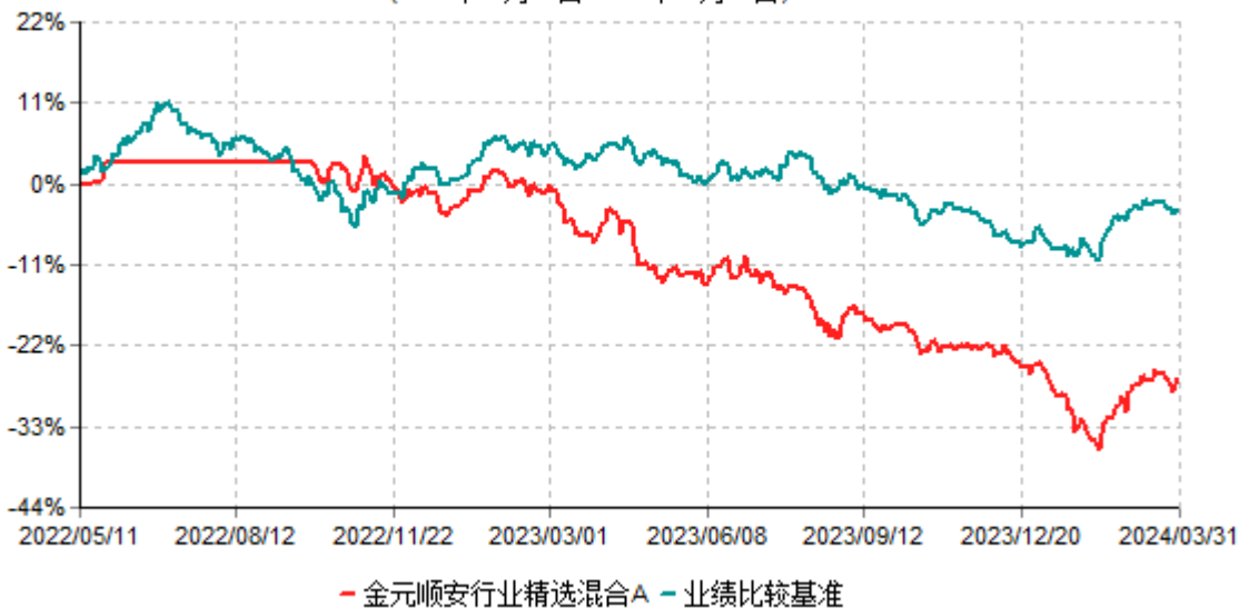
金元顺安行业精选混合A累计净值增长率与业绩比较基准收益率历史走势对比图 (2022年05月10日-2024年03月31日)