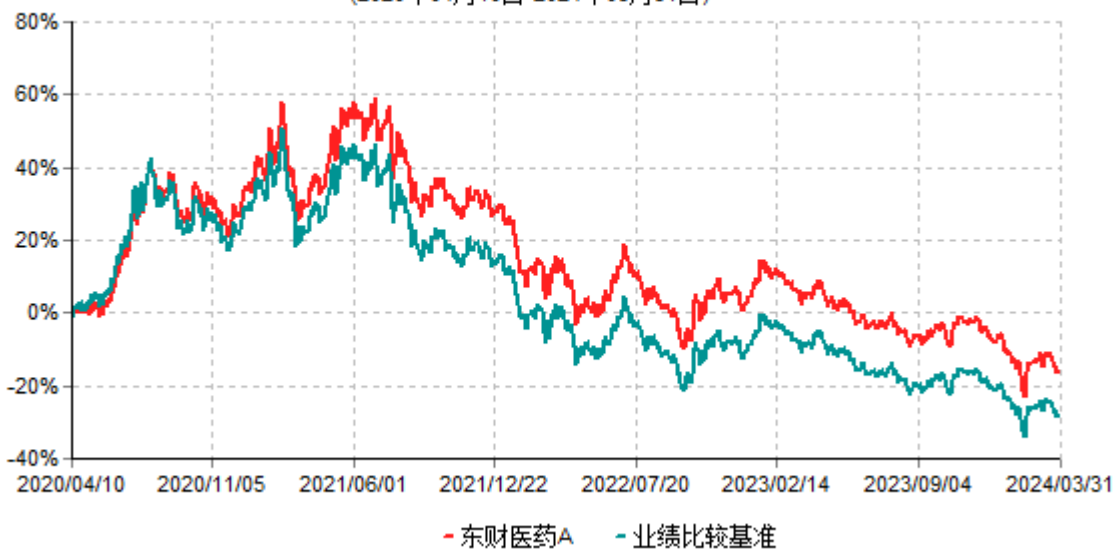
东财医药A累计净值增长率与业绩比较基准收益率历史走势对比图 (2020年04月10日-2024年03月31日)