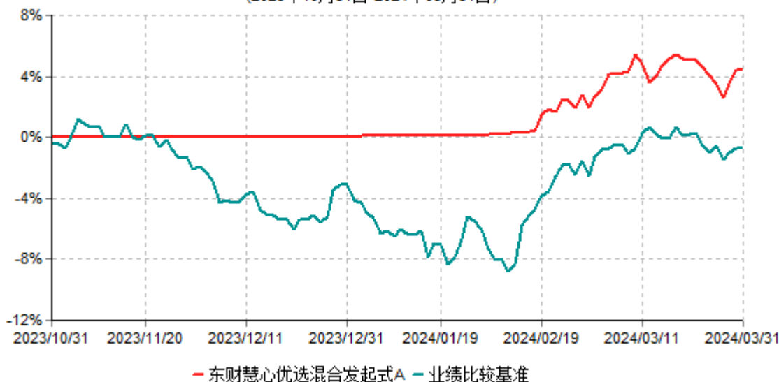
东财慧心优选混合发起式A累计净值增长率与业绩比较基准收益率历史走势对比图 (2023年10月31日-2024年03月31日)