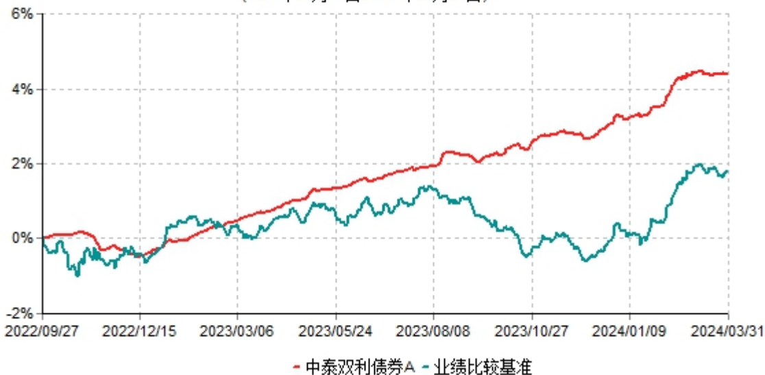
中泰双利债券A累计净值增长率与业绩比较基准收益率历史走势对比图 (2022年09月27日-2024年03月31日)