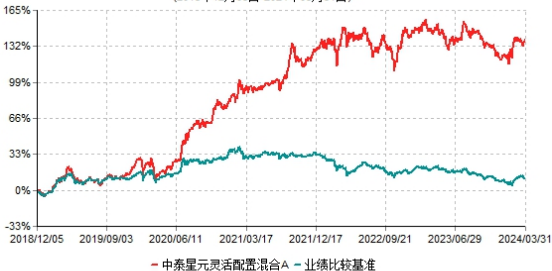
中泰星元灵活配置混合A累计净值增长率与业绩比较基准收益率历史走势对比图 (2018年12月05日-2024年03月31日)