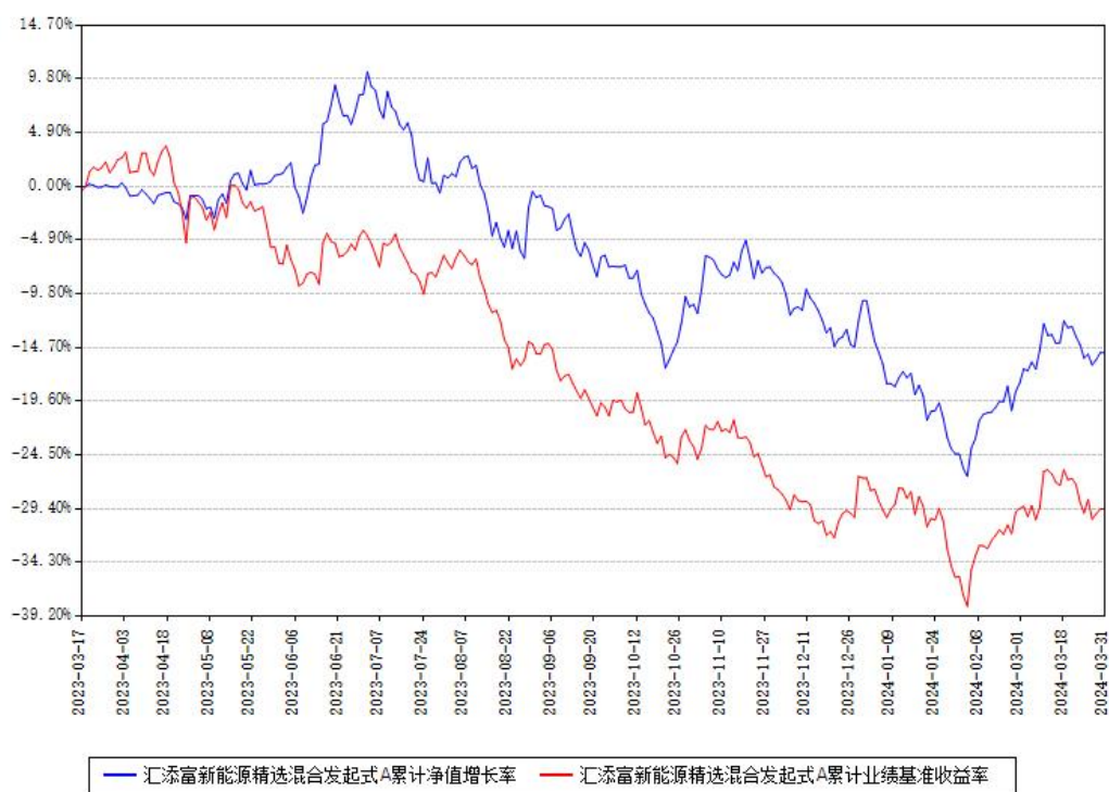
汇添富新能源精选混合发起式A累计净值增长率与同期业绩比较基准收益率对比图